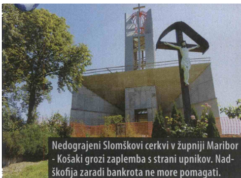
Nedograjeni Slomškovi cerkvi v župniji Maribor - Košaki grozi zaplemba s strani upnikov. Nadškofija zaradi bankrota ne more pomagati.