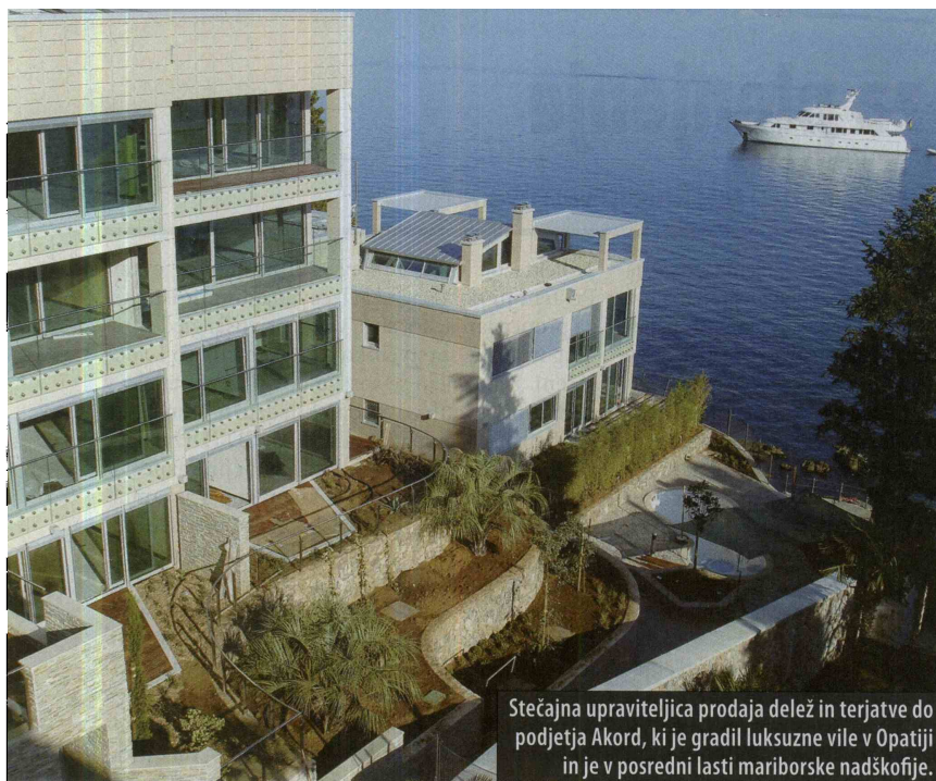
Stečajna upraviteljica prodaja delež in terjatve do podjetja Akord, ki je gradil luksuzne vile v Opatiji in je v posredni lasti mariborske nadškofije.

Prodajajo se tudi terjatve (9,5 milijona evrov) do hrvaškega podjetja Akord, ki je v lasti Zvona Ena. Akord je bil ustanovljen z namenom, da bo gradil luksuzne apartmaje v Opatiji. Gre za tri vile (Opatija, Arentz in Volosko), kreditodajalci pa so bili Zvon Ena, Banka Celje in Volksbank. Od 28 apartmajev so jih do zdaj prodali 16, šest jih je rezerviranih, šest jih še ni prodanih. Cena kvadratnega metra apartmaja je okoli 10.000 evrov, veliki pa so od 82 do 135 kvadratnih metrov. Naprodaj so še terjatve (9,4 milijona evrov) do hrvaškega podjetja Sole Orto, ki je bilo najprej v stoodstotni lasti Zvona Ena, kasneje pa je bila tretjina prodana kranjski Savi. Namen je bil, da se 32 hektarjev v Sutivanu na otoku Braču spremeni v zazidljivo zemljišče, ki pa je zdaj zastavljeno pri Gorenjski banki.