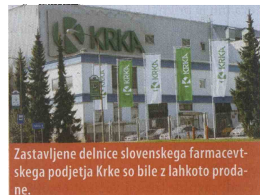
Zastavljene delnice slovenskega farmacevtskega podjetja Krke so bile z lahkoto prodane.

Glede zastavnih upnikov je Gaberčeva dejala, da so do zdaj unovčili večino zastavljenih delnic. Prodane so bile delnice Cetus Grafa (311.930 delnic), Krke (več kot 52.000 delnic), Etola (10.823 delnic), Telekoma (708 delnic), Iskre Avtoelektrike (230.739 delnic) in TKK Srpenica (32.998 delnic). Delnice MKZ (za okoli 22 milijonov evrov) so zastavni upniki Abanka, NLB in Hypo banka neuspešno prodajali, neunovčene pa so še delnice Gee in Beti Holdinga. Neuspešna je bila tudi prodaja 57-odstotnega deleža nepremičnine v Kopru (bivši najemnik Citroën) za 2,25 milijona evrov. Kasneje se hipotekarni upnik banke Raiffeisen ni strinjal z znižanjem