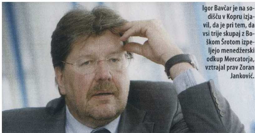
Igor Bavčar je na sodišču v Kopru izjavil, da je pri tem, da vsi trije skupaj z Boškom Šrotom izpeljejo menedžerski odkup Mercatorja, vztrajal prav Zoran Jankovič.