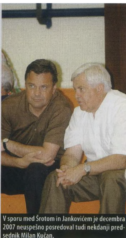
V sporu med Šrotom in Jankovičem je decembra 2007 neuspešno posredoval tudi nekdanji predsednik Milan Kučan.