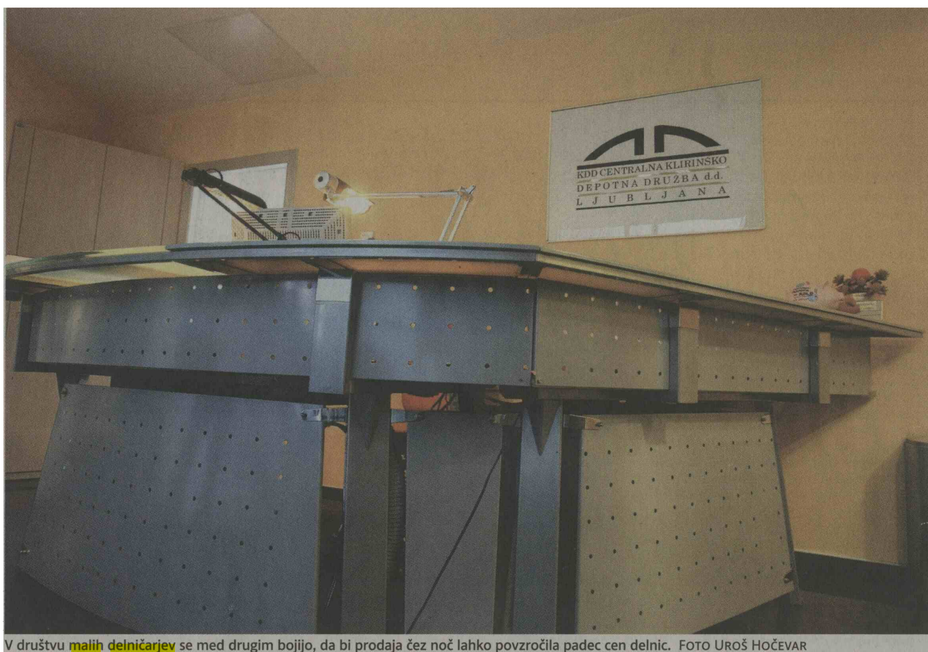
V društvu malih delničarjev se med drugim bojijo, da bi prodaja čez noč lahko povzročila padec cen delnic.