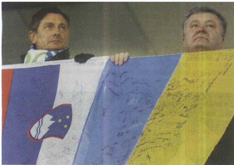
Borut Pahor in Peter Porošenko, lahkotno in lahkoverno