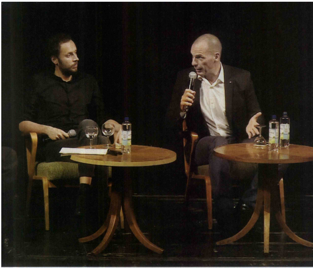
Franco Berardi Bifo, Srečko Horvat in Janis Varufakis na okrogli mizi Rezervni načrt za Evropo v Berlinu 6. oktobra

svoje mnenje, kako gre Grčiji, če se govori o Španiji, bi govoril, kako napreduje uresničevanje zahtev glede španskega proračuna, če je na vrsti Italija, govori o Italiji, Franciji. Nato spregovori predstavnik MDS . Šele nato dobi besedo minister iz države, o kateri se pogovarjajo. A na voljo ima le približno deset minut, da povzame položaj, da pove nekaj stvari. Ministri, ki sedijo tam, imajo pred seboj natančno nič podatkov o tem, o čemer se razpravlja. Nimajo mape s pojasnili, nobene statistike, nobenih podatkov, ničesar. Nič. Vedo le to, kar jim povedo predstavniki trojke. Nato ima besedo vsak od njih in pove nekaj stvari na podlagi popolne, totalne inherentne neobveščenosti.