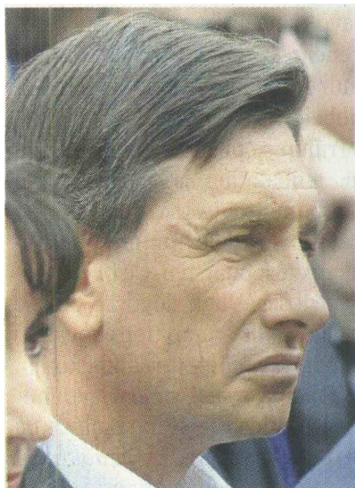
Borut Pahor skriva lastne zablode.