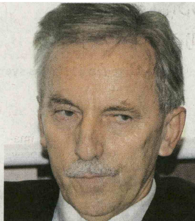
France Arhar ne odgovarja.