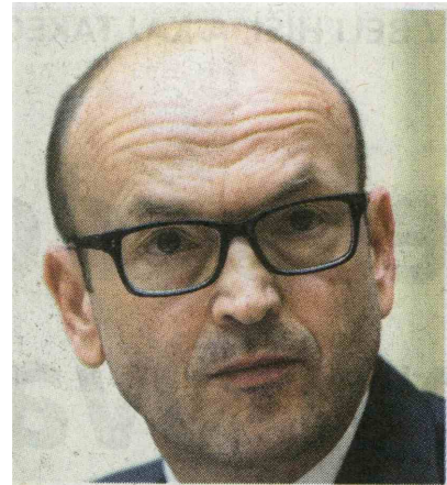
Boštjana Jazbeca strašijo.

Toda izganjanje hudiča iz slovenskega guvernerja začudeno spremlja finančna Evropa. V Bruslju, Frankfurtu in pri evropskih guvernerjih ima dr. Boštjan Jazbec izjemen ugled, slovenski model reševanja države pred trojko pa je postal vzorčen. Z obiskom v Sloveniji sta dr. Jazbeca počastila in podprla tako predsednik Evropske centralne banke Mario Draghi kot predsednik nemške Bundesbank Jens Weidmann . Oba sta potrdila, da je slovenska pot iz krize zgodba o uspehu, zato v tujini uspešnost vlade dr. Mira Cerarja vedno večkrat primerjajo z vlado dr. Janeza Drnovška . Seveda je tudi Pahorju jasno, da guverner dr. Boštjan Jazbec nikakor ne sme odstopiti, treba pa ga je vseeno strašiti, da bančna luknja ne bi preveč zatemnila bleščavo velikonočnega zajca. ■