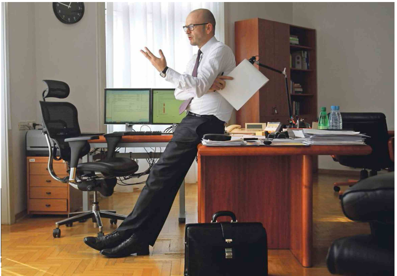
Guverner Boštjan Jazbec se je moral zaradi sanacije bank večkrat zagovarjati pred poslanci, na vrata Banke Slovenije pa so potrkali tudi kriminalisti.