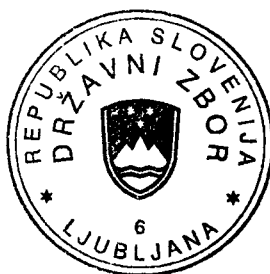
Urška Ban predsednica

Poslanke in poslance prosim, da me na podlagi 95. člena Poslovnika Državnega zbora obvestijo o morebitni odsotnosti in razlogih zanjo, in sicer najpozneje do začetka seje.